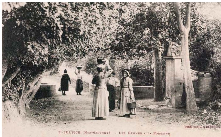
ST-SULPICE (HTE-GARONNE). - LES FEMMES A LA FONTAINE

De nombreuses fontaines et sources sont représentées sur le plan cadastral dressé en 1839. Elles sont disséminées sur l'ensemble de la commune, notamment près des fermes alentour. On peut y ajouter les multiples pompes observées dans les jardins et édifices privés.